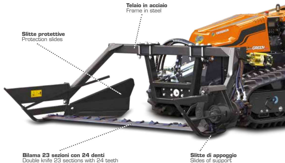
Testa di lama registrabile Adjustable knife head