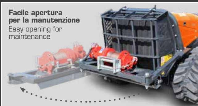
Facile apertura per la manutenzione Easy opening for maintenance